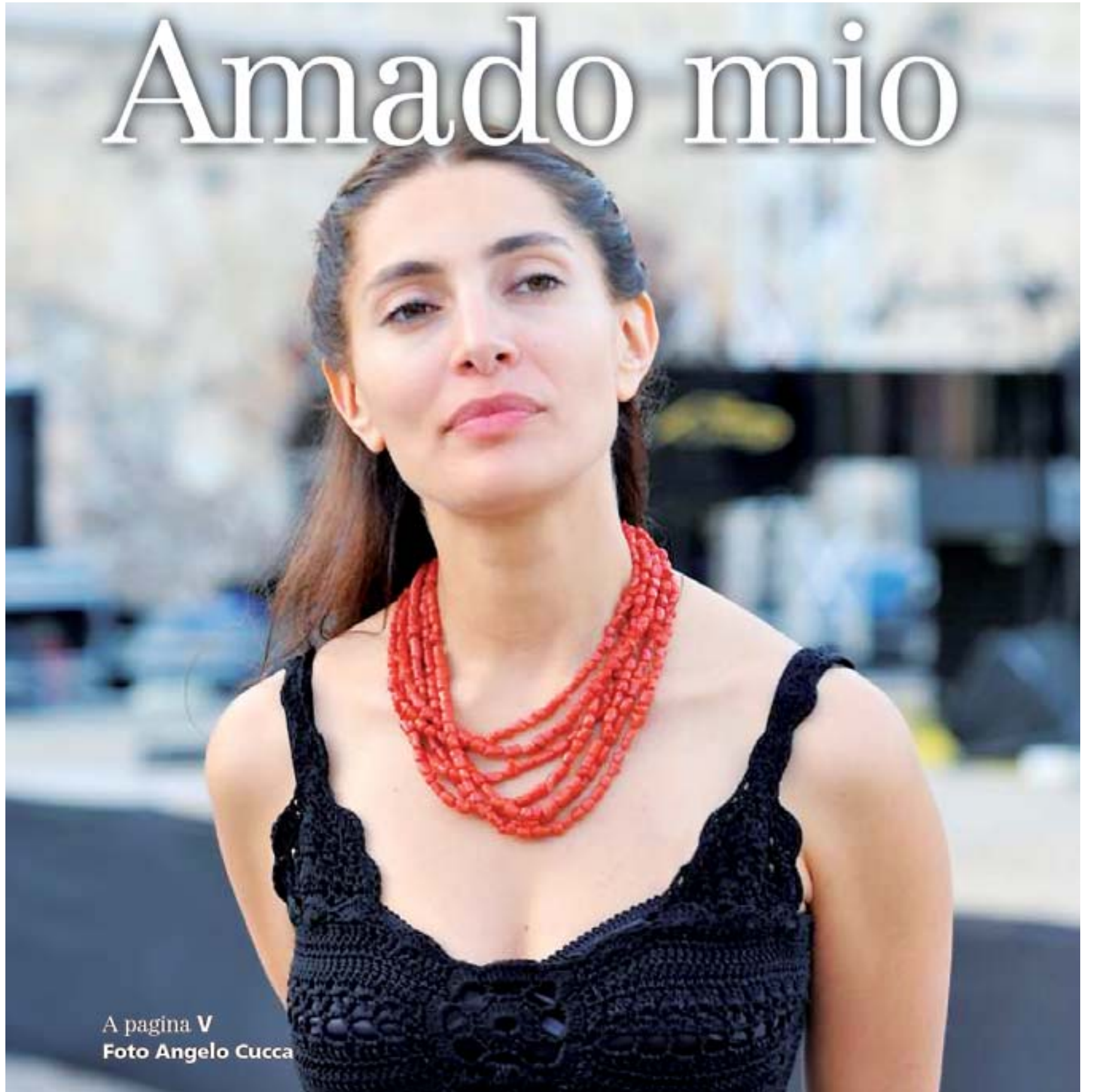
A pagina V